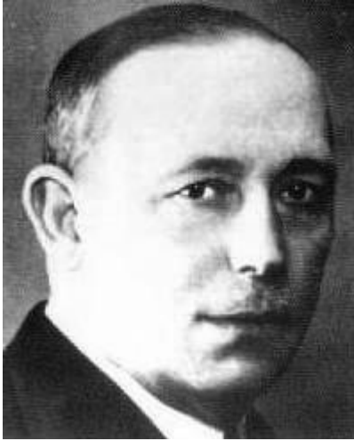
General Antonio Escobar. Jefe del ejército republicano de Extremadura desde Julio de 1938.

un nuevo cuerpo de Ejército, el XVII (MARTÍNEZ BANDE, 1985) El objetivo inmediato de la república era distraer tropas nacionales para ayudar a las divisiones republicanas que combatían el ataque de los sublevados en Cataluña. Los soldados republicanos lograron romper el frente enemigo, ocuparon parte de las provincias de Córdoba y Badajoz, localidades como Valsequillo, Fuenteovejuna, Granja y Peraleda del Zaucejo, Los Blázquez, y la Granjuela.