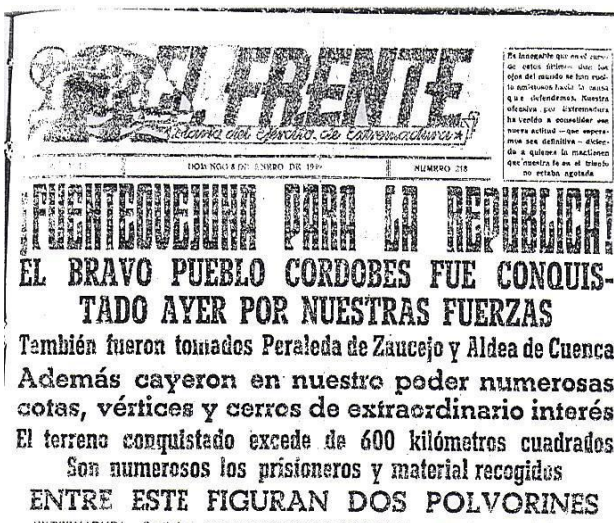
Recorte del periódico El Frente. Enero de 1939.

Estas operaciones se encuadran en el denominado Plan P, diseñado por el general Vicente Rojo. El Plan, de cuyo proyecto existe una copia fechada el 10 de Diciembre de 1937, tenía como objetivo principal dividir en dos la zona franquista, envolver el dispositivo “nacional” del II cuerpo de Ejército en el saliente Castuera-Cabeza del Buey, conquistando la zona de Mérida y Llerena y llegar a la frontera portuguesa, para aprovechar después el avance conseguido y avanzar en dirección Sur.