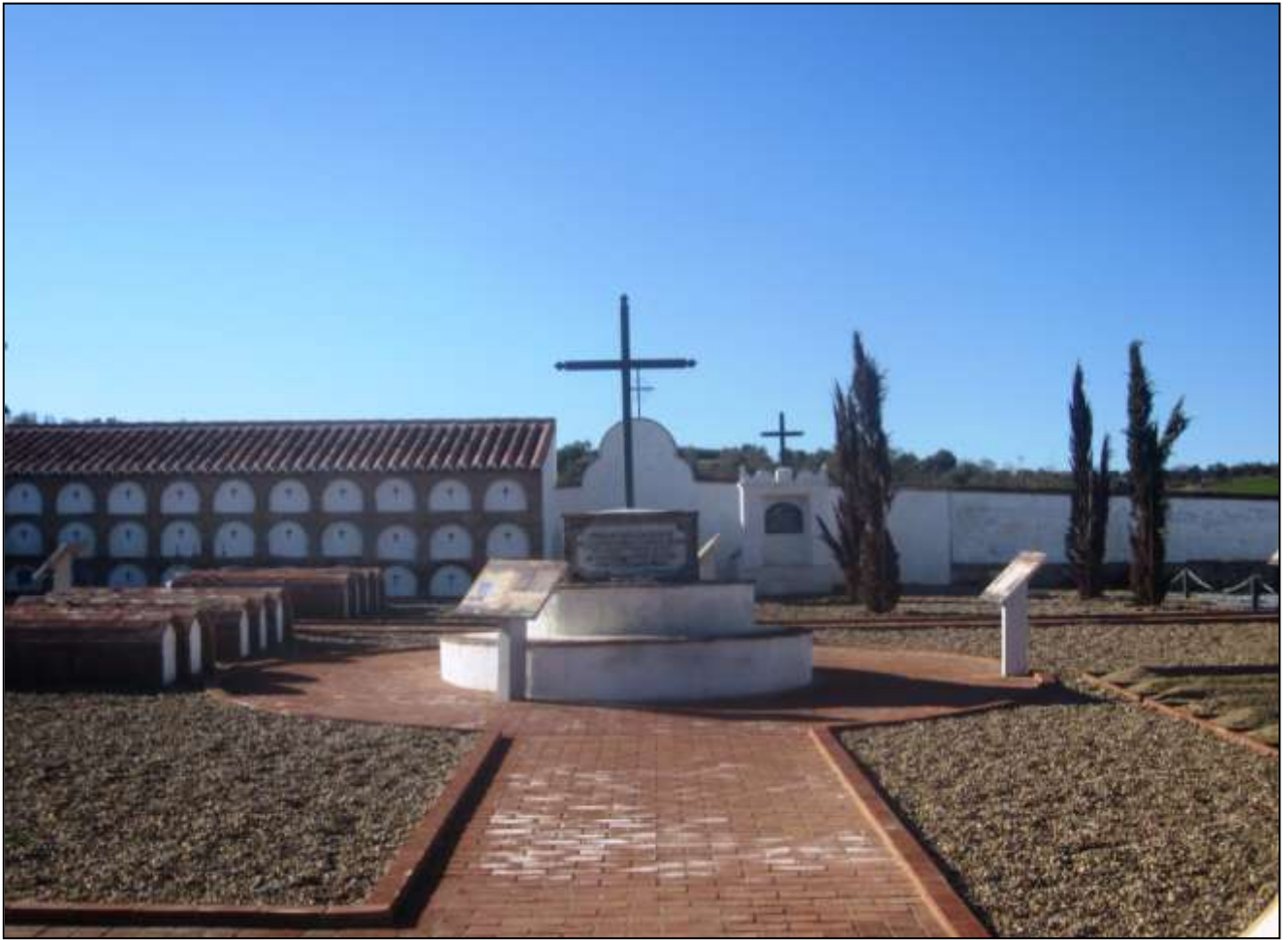
Fig. 4 Aspecto actual que presenta el cementerio de los italianos en Campillo de Llerena, tras la restauración de 2011.