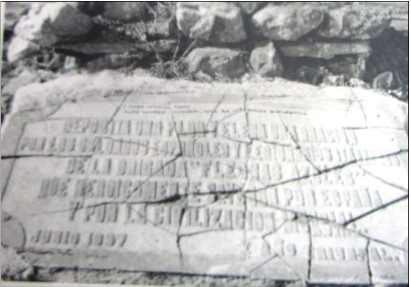
Fig. 2 y 3. Tumbas abovedadas añadidas con posterioridad a 1937 y placa conmemorativa existente en el monumento central